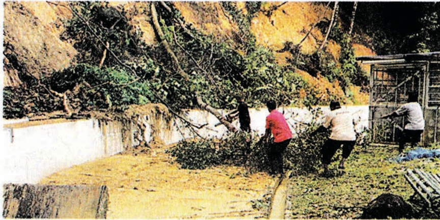
水池路蓄水池多处树木倒下。

另外，檳州供水机构与大马武装部队展开“紧急水源援助”以协助水灾灾黎，这群队伍在周一下午3时至8时在7个地区进行，分别是打昔牛汝莪救灾中心、打昔牛汝莪礼堂、打昔牛汝莪 Padang Menora 国中、檳岛亚依淡 Al-Mashoor 国中、大英义学园、吡叻路清真寺一带及大英义园 Solok Rawana。救灾队伍除了提供饮水，也协助灾黎清理家园。#